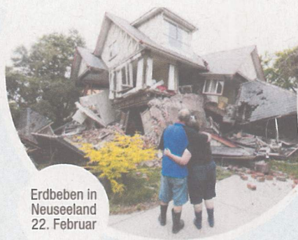
Erdbeben in Neuseeland 22. Februar