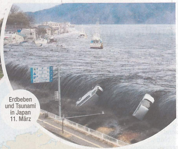
Erdbeben und Tsunami in Japan 11. März